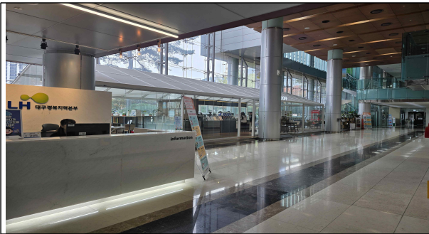
[1층 북측로비, 시니어클럽 수아] 안내 데스크와 휴식과 음료를 제공하는 카페

또한, 1층에 카페, 4층에는 하늘정원이 잘 꾸며져 있어 업무에 지친 직원들이 쉬어갈 수 있어, 현대적 디자인을 갖추고 있으면서 따뜻한 온기를 가진 곳입니다.