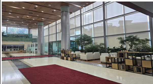
[1층 남측로비] 외부 방문객을 위한 미팅룸과 응대공간