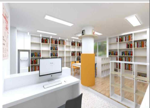
마음의 양식 "도서관"