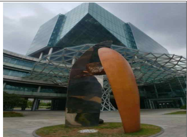
입구를 장식하는 "보금자리" 조형물