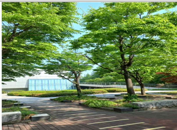
업무집중력 향상을 위한 "쉼터"